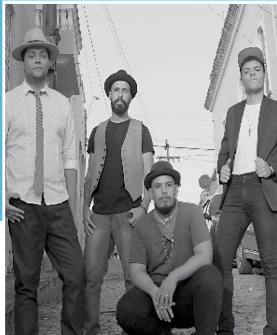
A banda pessoense About The Blues