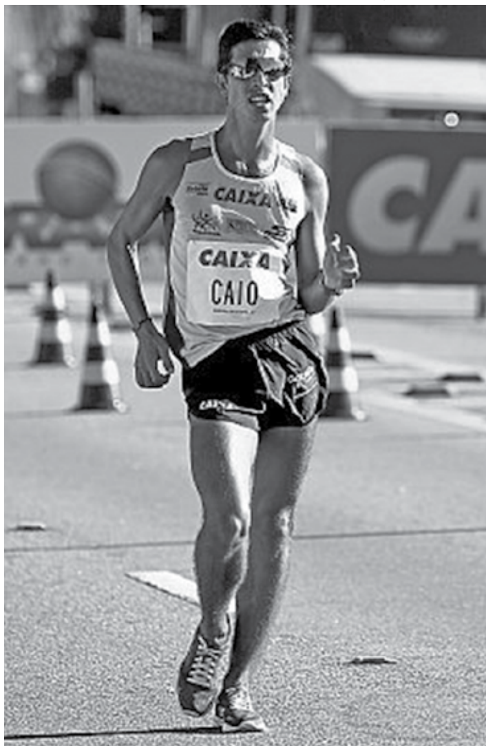
O brasileiro Caio Bonfim vem se destacando na marcha atlética