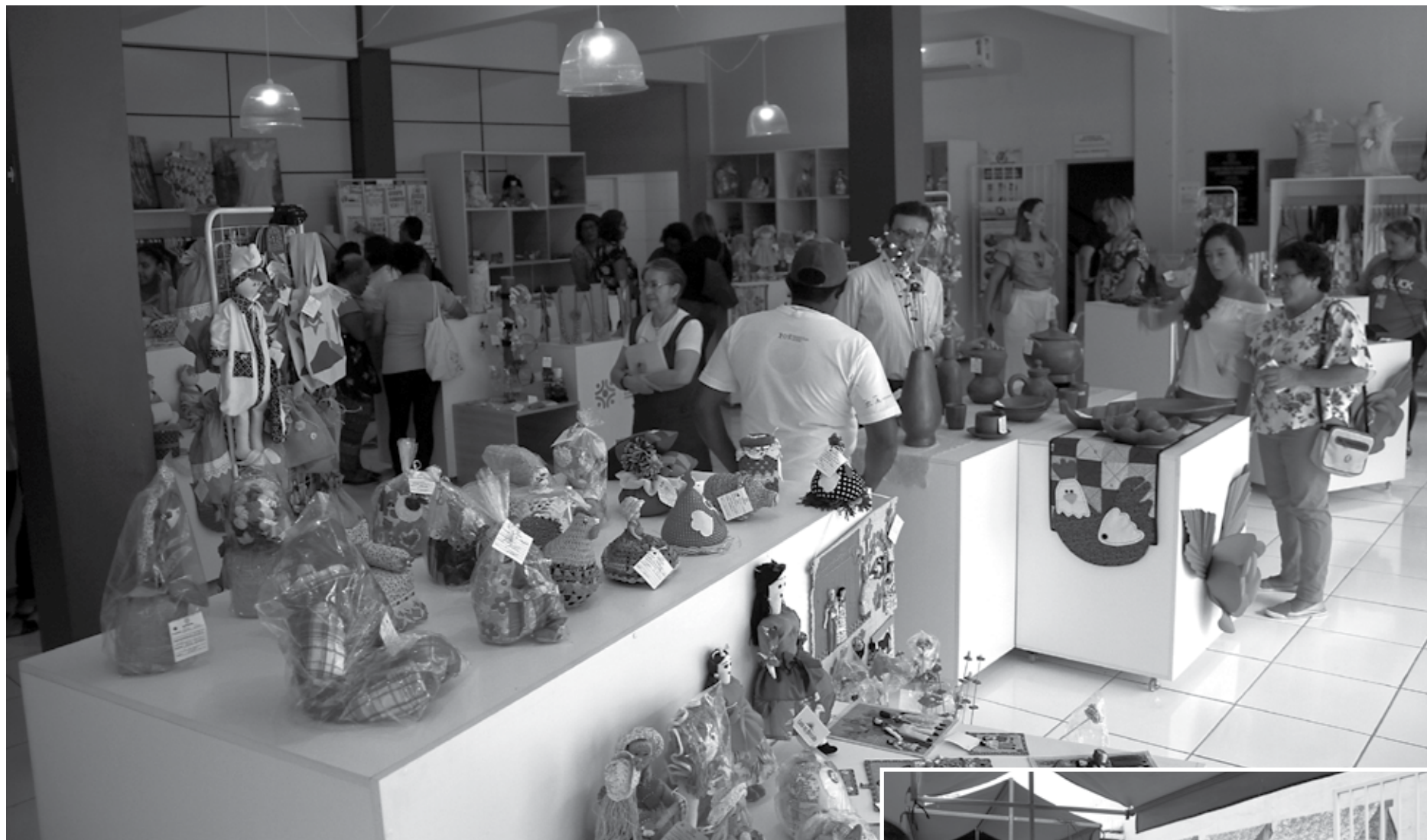
A renda renasçença, a cerâmica e outros artigos construídos artesanalmente se destacaram nesta exposição