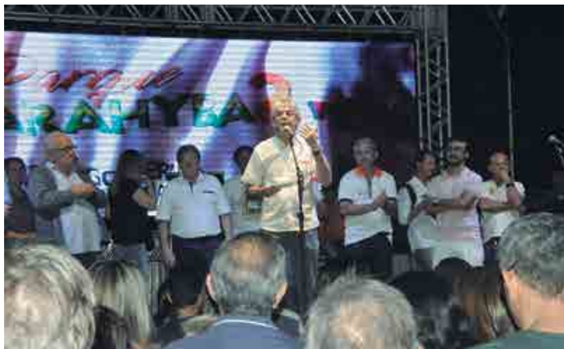
Inauguração da segunda etapa do Parque Parahyba, pelo governador Ricardo Coutinho, contou com diversas atividades, entre elas apresentações culturais, ações educativas para o meio ambiente, oficina de reciclagem, show infantil, entre outras

O secretário de Infraestrutura, Recursos Hídricos, Meio Ambiente, Ciência e Tecnologia, João Azevêdo, comentou que a obra demonstra a preocupação que o Governo do Estado tem em criar ambientes de lazer para a sociedade. "Este local se transforma em uma enorme praça que pode ser comparada com uma grande sala de estar, onde a convergência das pessoas vai acontecer. Aqui são mais de R$ 4 milhões investidos e como