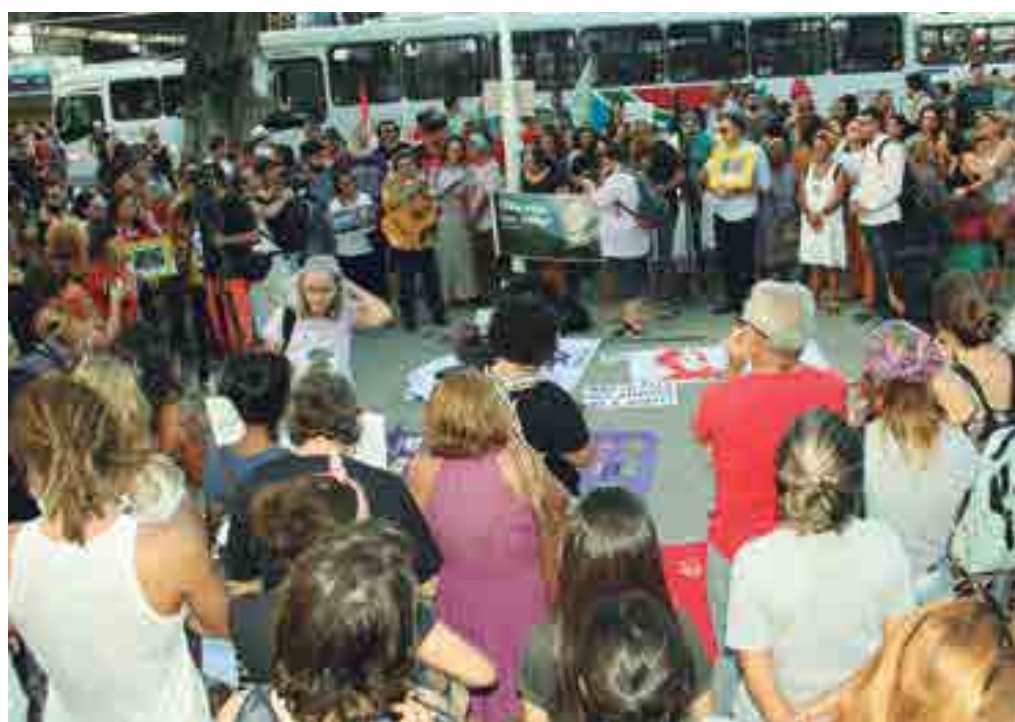
Reunidos na Lagoa, manifestantes qualificaram o assassinato de Marielle Franco como um crime político

Em seus discursos, muitos oradores qualificaram o brutal assassinato de Marielle Franco como um crime político. “Foi um crime político para calar a voz do povo brasileiro. Suas denúncias contra as mortes e agressões a negros, mulheres, comunidades pobres e a comunidade LGBT tinham se intensificado devido a intervenção militar no Rio de Janeiro. Isso incomodou mais ainda a muitos pode-