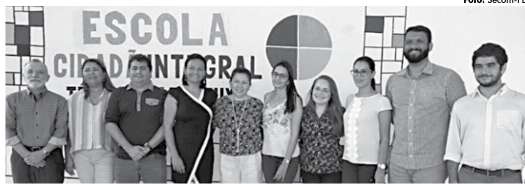
Professores e gestores do Estado de Pernambuco estiveram ontem na Escola Cidadã Integral Técnica de Bayeux

A equipe de Pernambuco visitou a escola e conheceu como funciona o projeto. "Quando estivemos em São Paulo, no II Encontro de Estados Parceiros do Itaú BBA, apresentamos o nosso modelo de escola cidadã, com a implantação de currículos baseados em competências e habilidades, matrizes articuladas e três metodologias de ensino.