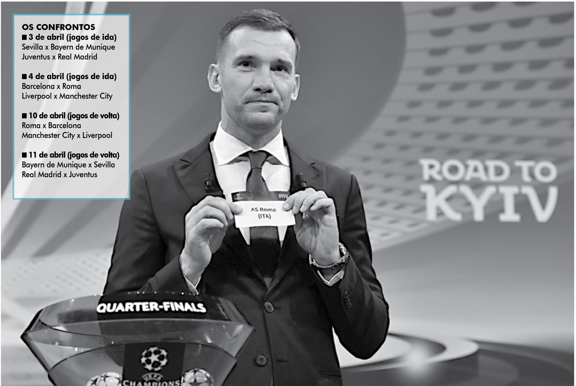
O ex-jogador Shevchenko participou do sorteio da Champions League, ontem, na Suíça, quando foram definidos os confrontos das quartas de final com destaque para o jogo Real x Juventus

■ 11 de abril (jogos de volta) Bayern de Munique x Sevilla Real Madrid x Juventus