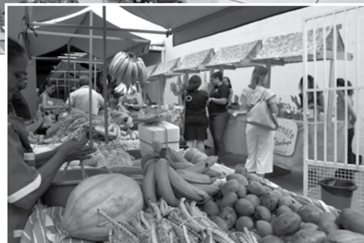
A Feira Agroecológica trouxe à venda uma variedade de produtos orgânicos

principalmente para o fortalecimento da organização de mulheres e homens que são pessoas oriundas das classes D e E, mais que conseguem se organizar e muitos deles, inclusive, a gente tem declarações de que deixaram o Bolsa Família e já têm seu próprio negócio", comemora.