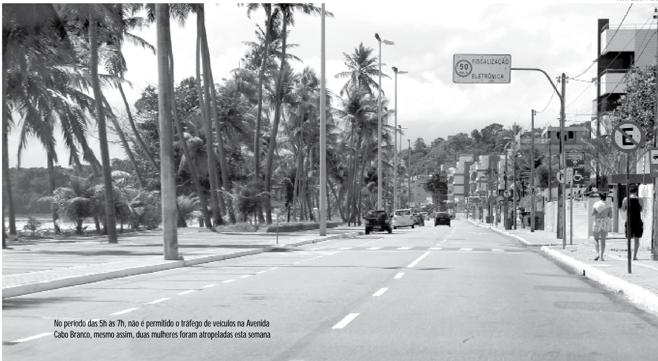
No período das 5h às 7h, não é permitido o tráfego de veículos na Avenida Cabo Branco, mesmo assim, duas mulheres foram atropeladas esta semana