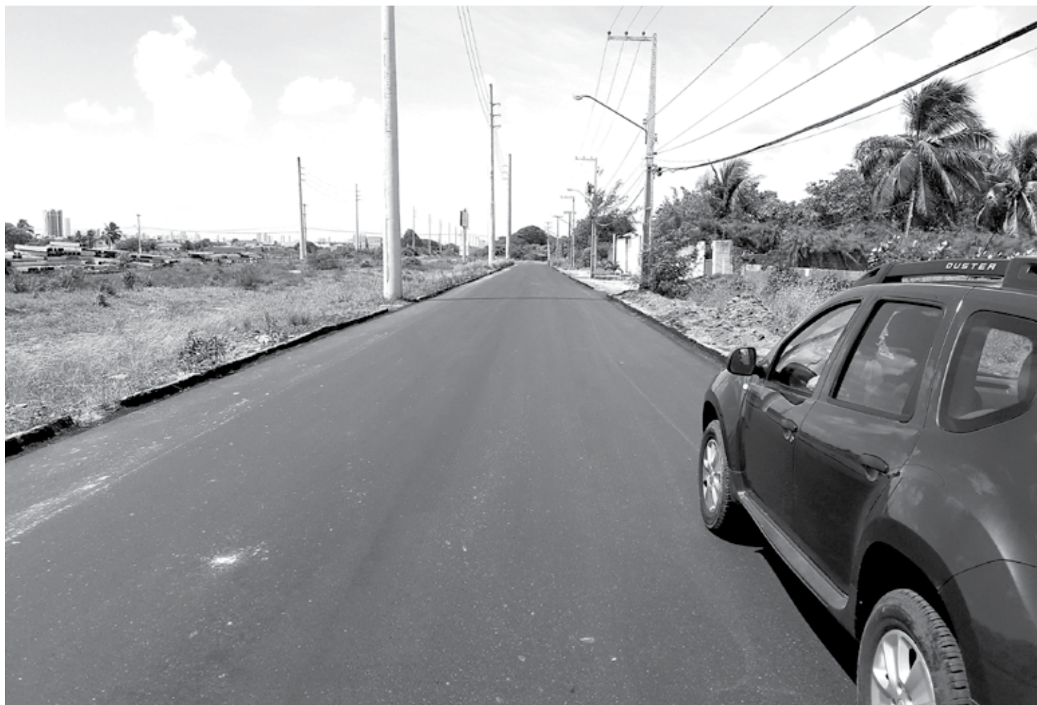
Pavimentação já está toda executada, faltando agora apenas realizar a sinalização horizontal e vertical na avenida localizada em Cabedelo

A pavimentação foi executada em CBUQ (Concreto Betuminoso Usinado a Quente), calçadas em concreto e sinalização vertical e horizontal, tendo como construtora a Fênix Ltda, empresa ganhadora da concorrência pública.